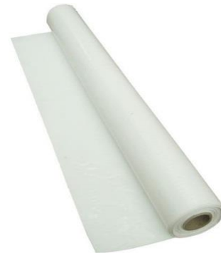
Polythène 6 mill.