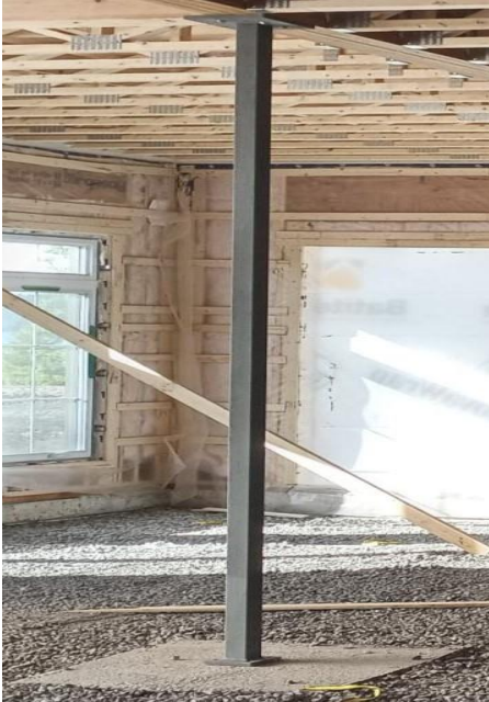
Poteau fixe en acier (HSS)