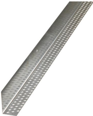
Moulure en L ventilé (anti-vermine)