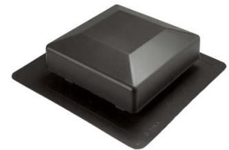
Ventilateur pour toiture basse