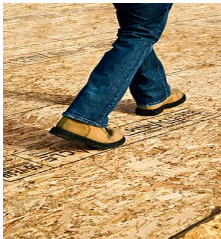
Panneau structural en bois d'ingénierie embouté