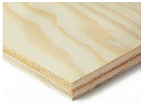
Panneaux de contreplaqué