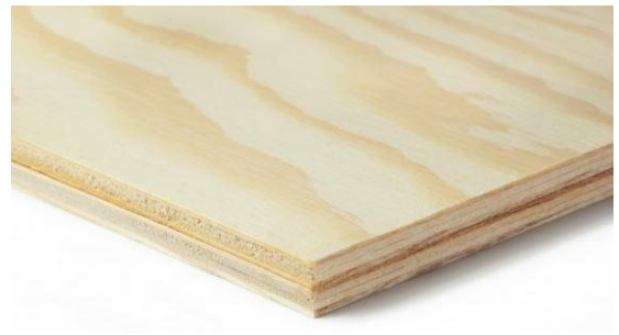
Panneaux de contreplaqué