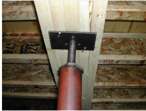
Poutre encastrée dans le plancher avec poteau ajustable