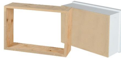
Trappe d'accès à l'entretoit isolée