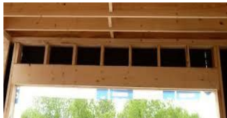
Linteau au-dessus des ouvertures