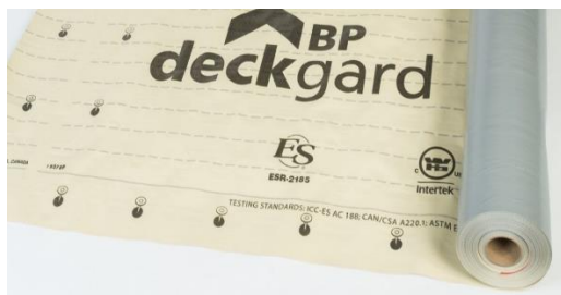
Membrane de sous-couche synthétique