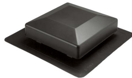
Ventilateur pour toiture basse (mono-pente)