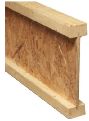
Poutrelle en « I »