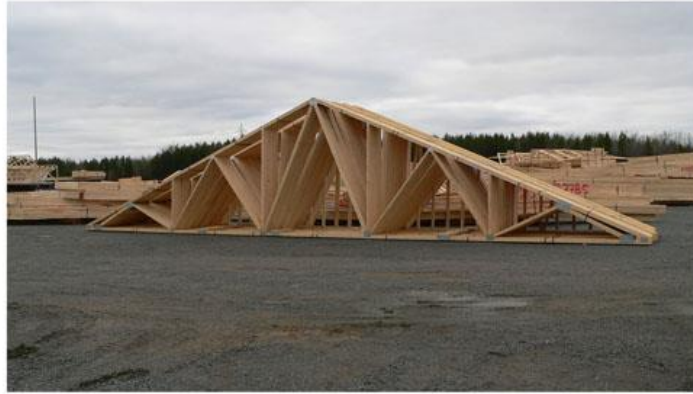
Ferme de toit standard