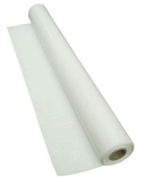
Polythène 6 mill.