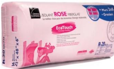
Fibre de verre en natte