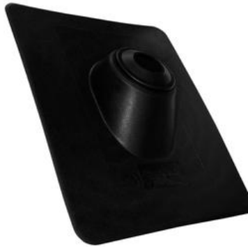
Solin d'évent de plomberie